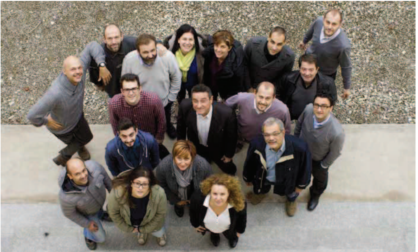
Lo staff di GEP informatica

L'azienda corseggese è riferimento tra le società che offrono soluzioni per la logistica e il trasporto