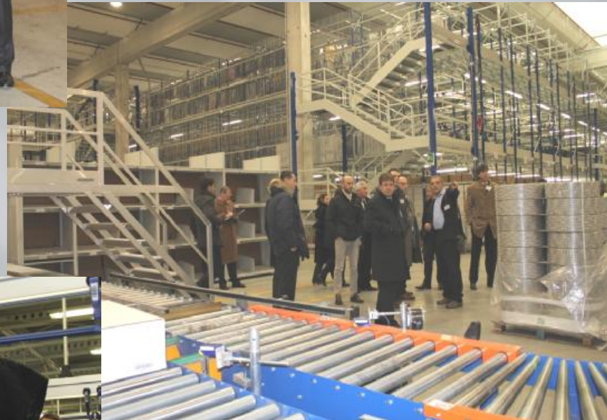
Impianto di movimentazione e imballaggio automatizzato.