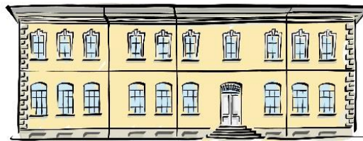
La Scuola Logistica

confimi emilia Associazione delle Imprese Manifatturiere del Territorio Emiliano